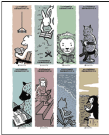
イラスト ©フジモトマサル