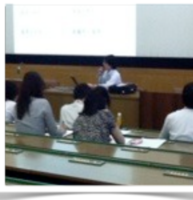
2011年度阿部氏講演の様子

研修分科会第2回からの課題は、この「図書館員のためのリポジトリ」に登録していただきます。