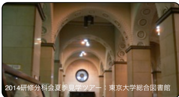
2014研修分科会夏季見学ツアー：東京大学総合図書館

①『新たな未来を築くための大学教育の質的転換に向けて～生涯学び続け、主体的に考える力を育成する大学へ～（答申）』中央教育審議会 平成24年8月28日