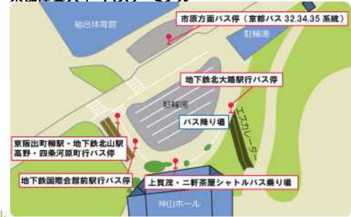
京都産業大学 バスターミナル